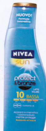
Accelera il colorito Protect & Bronze Latte Solare Spf10 Corpo, Nivea Sun (€13,50).