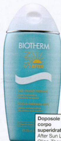
Doposole corpo superidratante After Sun Lait Oligo-Thermal, Biotherm (€26).