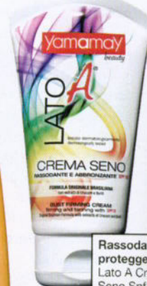
Rassoda e protegge Lato A Crema Seno Spf15, Yamamay Beauty (€18,90).