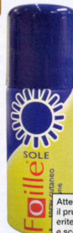
Attenua il prurito di eritemi e scottature Foille Sole Spray Cutaneo, Sanofi (€10,30).