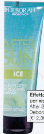
Effetto ghiaccio per viso e corpo After Sun Ice, Deborah Bioetyc (€12,30).