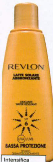
Intensifica il colorito Latte Solare Abbronzante Corpo Spf6, Revlon (€17,40).